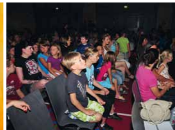
Kinder erwarten gespannt die Aufführung