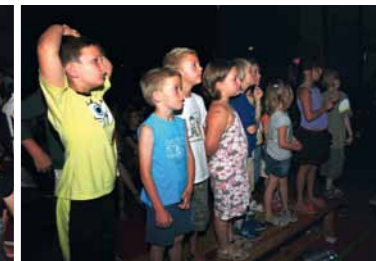
Spannung und Begeisterung während der Veranstaltung

Die Kiwanis-Foundation unterstützt diese Veran- staltungen im Rahmen der Vergaberichtlinien. Geheimsache Igel ver-